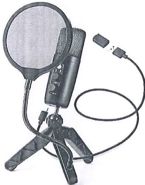
Pasa el mouse encima de la imagen para aplicar zoom