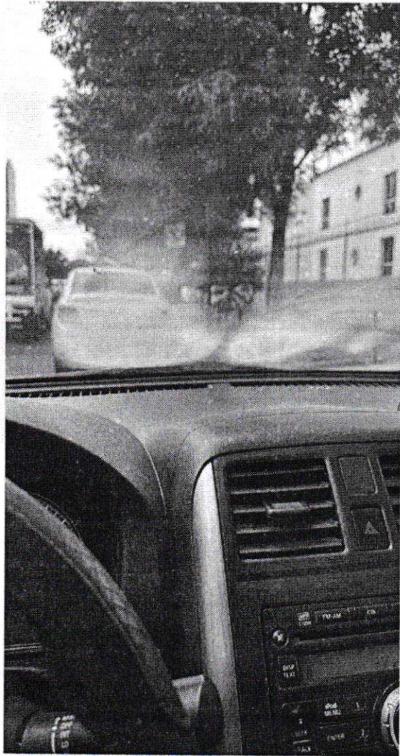
PROBLEMA CON EL SISTEMA DE ENFRIAMIENTO/CALEFACCIÓN NISSAN VERSA 2012 PLACAS JJZ-2454