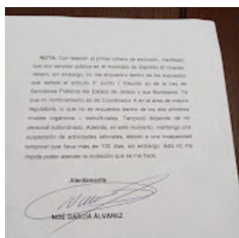
Carta 2.jpeg 116K